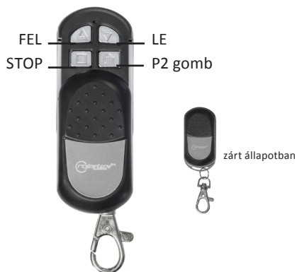
1-csatornás mini távirányító RHSM1